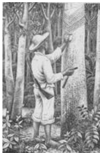
Ilustração: Percy Lau

Como vimos até aqui, a categoria “populações tradicionais” engloba diferentes coletividades, com modos de vida específicos, espalhados por todo o país, e que tem em comum a sustentabilidade como modo de relação com o ambiente. Dentre essa diversidade, os seringueiros são um dos grupos de maior representatividade, pois sua história de lutas pelo reconhecimento de seus direitos territoriais inaugurou uma nova fase nos processos de regularização fundiária no Brasil por meio da criação das