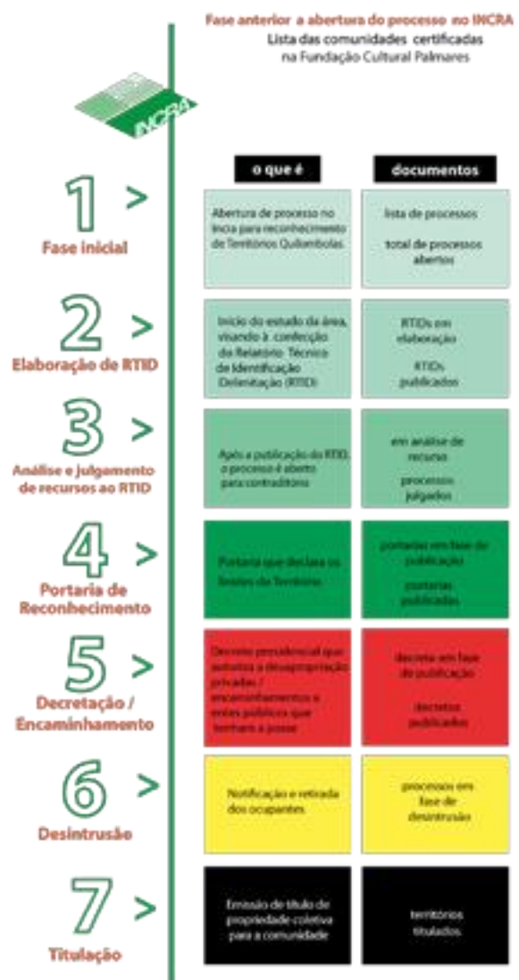
Quadro Geral da Política de Regularização Quilombola